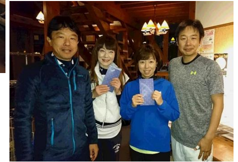
準優勝 せっかくのご縁ですから